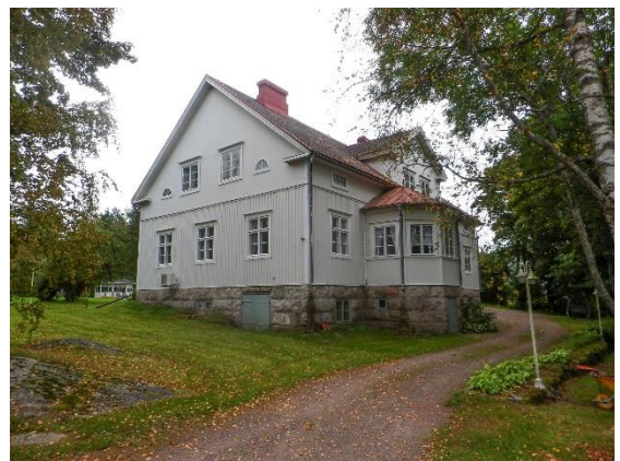
Pukkilan kylän Ylöstalon pihapiirissä on useita vanhaan kyläkuvaan kuuluvia rakennuksia.