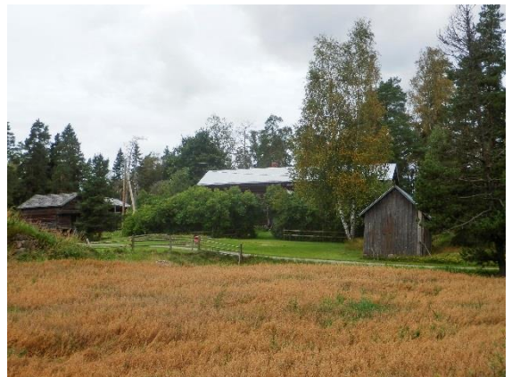
Jukolan talon esikuvana on hyvin säilynyt kruunun uudistalo Ojakkala vuodelta 1783, aitassa on vuosiluku 1797.