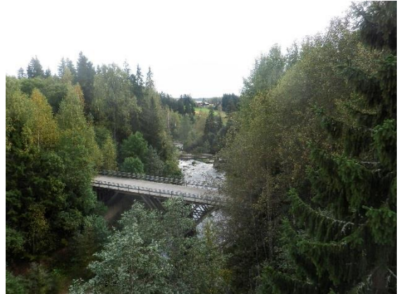
Mylykoskessa on nyt neljä ylitystä ja aikanaan siinä on ollut myllyt molemmilla rannoilla sekä saha ja sähkölaitos, joiden rakenteita voi vieläkin nähdä.