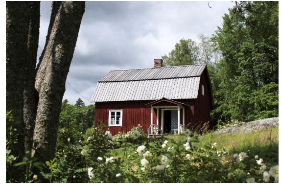
Taitekattoinen syntymäkoti oli rakennettu vuonna 1824 vankalle kivijalalle keskelle kylää. Lapsuuden kodissaan ja kotimaisemissaan Aleksis vietti ensimmäiset 12 ikävuottaan.

Palojokilaaksosta noustessa vasemmalle jää Kiven syntymäkoti (D) ja oikealle Taaborinvuori , jotka molemmat ovat museo- ja käyntikohteita. Nurmijärven Kivi-juhlat ovat tehneet Aleksis Kiven tuotantoa tunnetuksi yhtäjaksoisesti yli 60 vuoden ajan.