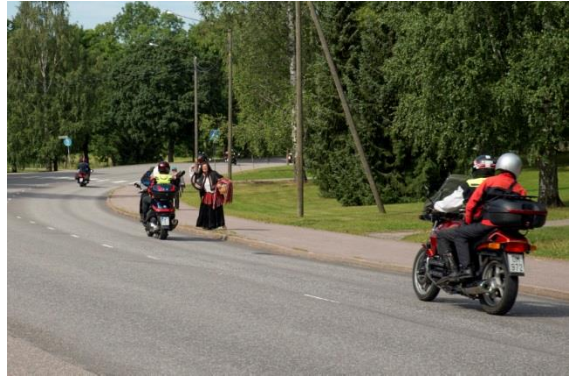
Kaisa noituu motoristeja susilaumaksi, kuten Jukolan veljeksiä. Hyväntekeväisyysajo 2014.

Jatka pohjoiseen ja nauti mutkista ja korkeuskäyristä yli ”Sonnimäen, jossa veljekset, iloisina kuin oinaat, viettivät vapauden hetkeä nummen korkealla harjulla”. Varo kuitenkin ettei ”Rajamäen Rykmentti” eli romaanin mustalaisten Mikon ja Kaisan matkue tule vastaan. Laskeudut mäeltä ” Toukolan kylään ”(F). Pukkilan kylän komeata Ylöstalon taloryhmää vastapäätä voi erottaa vielä Kiven isoisän talon rauniokasan. Vasemmalla aukesi Kiven aikaan kaislikkoinen ja matala Nurmijärvi, joka myöhemmin kuivatettiin viljelysmaaksi.