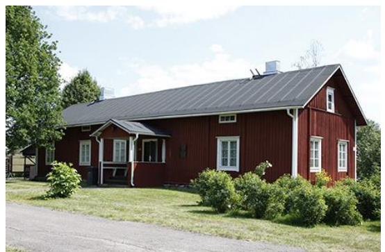
Vanha sotilasvirkatalo Saksan puustelli on itseoikeutettu paikka sotilasperinne-näyttelylle.