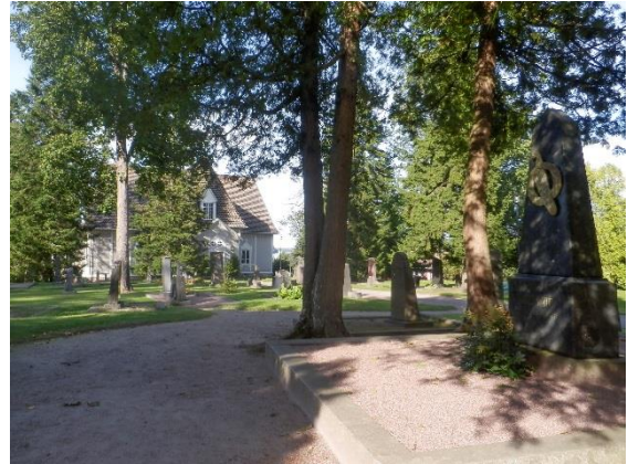
Aleksis Kivi 1834–1872 hautamuistomerkki on Tuusulan kirkkokuistossa. Patsaan takasivulla on teksti Seitsemästä veljeksestä: ”Kotomaamme koko kuva, sen ystävälliset äidinkasvot olivat ainiaksi painuneet hänen sydämensä syvyyteen”.