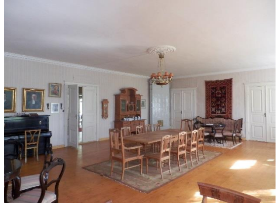
Kartanon hienossa salissa vietettiin Aleksin veljien Juhanin ja Emanuelin kaksoishäitä vuonna 1855.

Rantatiellä ajetaan hiljaa ja ohitetaan historiaa havisevia nimikylttejä: Kuninkaala, Halosenniemi, Ukko-Pekan tie, Taistelukoulun alue, Lotta-museo, Onnela, Erkkola ja Aleksis Kiven kuolinmökki (M) .