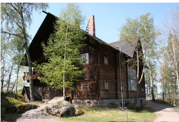
Kivi oli mestari luonnonkuvaajana sulkakynällä, Pekka Halonen siveltimellä. Taidemuseona toimiva Halosenniemi on entisöity alkuperäiseen asuunsa.