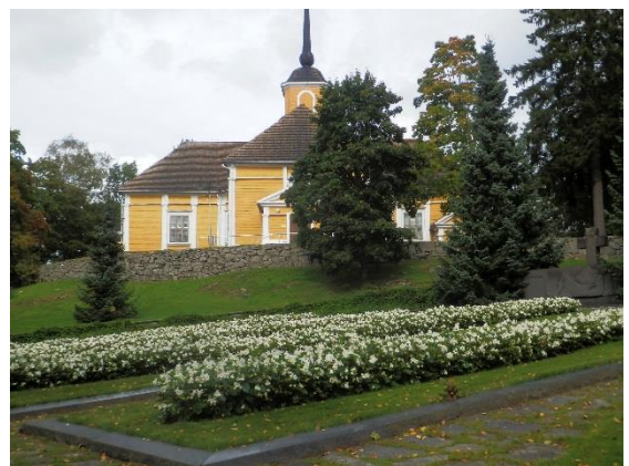
Nurmijärven kirkko, jota Kivi on ihailut; tornin tasaiset suhteet, kellojen syvämielinen sointu, alttarin symmetria ja yksinkertainen sulous sekä Neitsyt Maria, naiskauneuden ihanne tekivät kaikki Aleksis-poikaan syvän vaikutuksen.