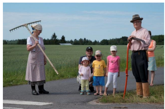
Kirkonrakentaja ja Kiven äiti nähtiin roolihahmoina Hyväntekeväisyysajossa 2014