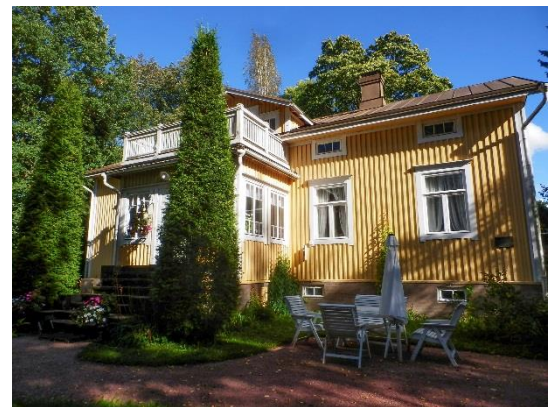
Saksan talo 1930-luvun asuun kunnostettuna. Hautajaisten 100-vuotispäivän muistoksi Tuusulan kunta lahjoitti seinälaatan ja Aleksis Kiven Seura piti kokouksen Saksalla.