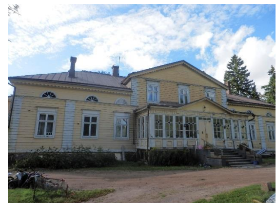
Raalan kartano on ollut reilut sata vuotta Palhon suvulla.