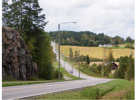
Paloonmäeltä avautuu "kotomaamme koko kuva" ja "kärmeilevänä kiemurtelee" Palojoki laaksossaan.

Paloonmäen jyrkkää rinnettä lasketeltaessa avautuu Kiven jylhä perusmaisema Seitsemän veljeksien Eeron sanoin: "kotomaamme koko kuva, sen ystävälliset äidinkasvot" . Kiven runouden herkimmät kuvaukset kylämaisemasta ovat runoissa Helavalkea, Onnelliset ja Keinu. Paloonmäellä oli kyläkeinu, jota Aleksis ehkä kuvasi runossaan "heilahda korkeelle keinu ja liehukoon impeni liina" .