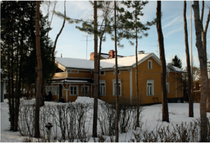
Ali-Jussilan pää-rakennus laajeni ristinmuotoiseksi, kun toimistotilojen lisäksi rakennettiin asuntosiipi 1980-luvulla.