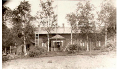
Mikkolan vanha päärakennus on sijainnut Björkbackankujan päässä ja julkisivu on ollut etelään. Rakennus on purettu 50-luvun alussa.