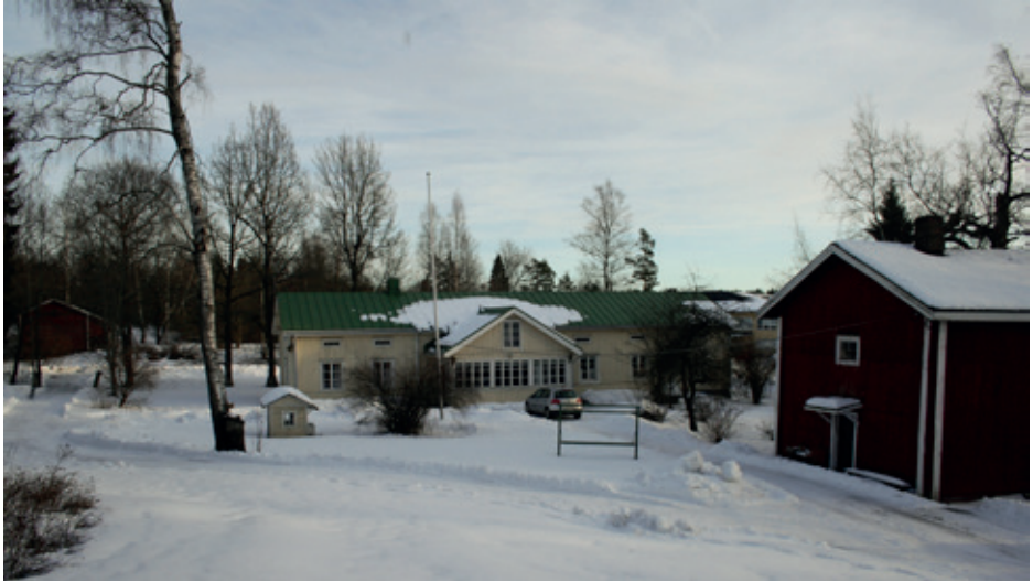
Rusthollin pihapiiriä aitan parvelta kuvattuna. Talon vanhin osa on oikealla ja sen takaa piikistää koulukeskus. Vasemmalla taustalla näkyy riihirakennuksia, oikealla on maitohuone vuodelta 1793.

koulukeskuksen pohjoispuolella. Vanha kantatalo lienee sijainnut koulukeskuksen paikalla.