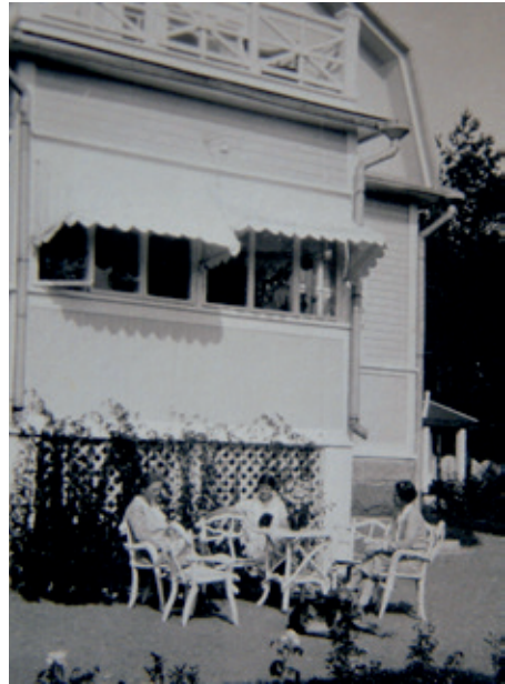
Rouvat rupattelevat pitsihuvilan aurinkoisella ruusutarhojen ympäröimällä terassilla.

Marginon parin hehtaarin tila ulottui Pajjalantieltä järvelle. Tilalla oli suuri kakikerroksinen päärakennus, joka remontoitiin Sohlbergien aikana upeaksi pitsihuvilaksi. Tontilla oli myös useita pienempiä rakennuksia, kuten palvelijoiden asunto ja talusrakennuksia. Pihapiirissä oli myös navetta, jossa oli lehmä ja kanoja. Puutar-