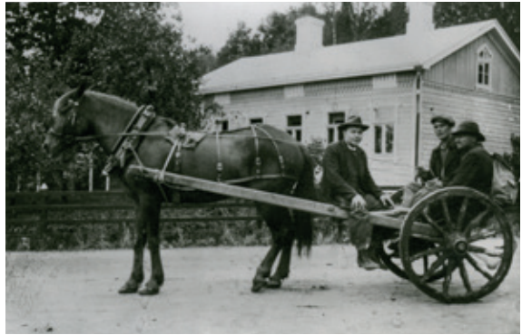
Ylitalon kievari hevosaikana.

On Ylitalon kievarissa majoittunut Eino Leinokin 1920-luvun alussa. Kirjaton ja karjaton kansallisrunoilijamme on ollut kortteerissa Tuusulassakin lähes kymmenessä talossa, joista Onnela