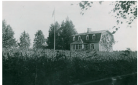
Mikkolan päärakennuksen viereen 1920-luvulla alussa rakennettiin ns. Lönngrenin huvila. Kuva Jouko Launeen albumista.