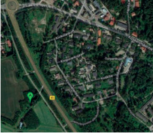
Googlen satelliittikuva Koskenmäestä. Piste A alueella on ollut Lindroosin tilakeskus ja myös Tappi-Villen kivityöpaja.