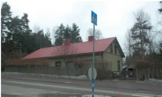
Karjalaisen tai Tolvasen kauppana tunnettu vanha maakauppa on historiaa ja rakennuksen kohtalona on purkaminen. Rakennusoikeutta tontilla on viereisen kerrostalon verran.