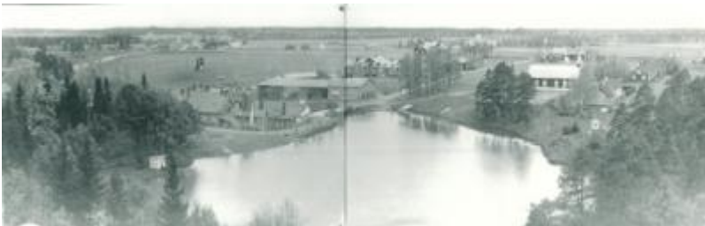
Ruukkialue vuonna 1933